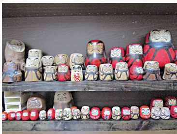
自慢のだるまの作品

食事不規則で健康面でも不安があり入居を決めました。今の暮らしは以前と同じリズムで自転車での買い物、図書館などを廻っています。以前から好きだっただるま作りを続