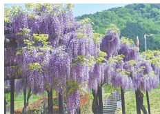
M・Y様撮影 白井大町藤公園