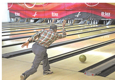
ボウリング大会での気合の一投

入居前に心配だった健康面は、ジムトレーニングを続けたお蔭で改善しています。今まで出来なかつた片足立ちもできるようになったんです。暖かく励ましてくれたトレーナーに感謝しています。これからはまだ勇気がありますが、もっといろいろな方とお話したい、里の行事にも参加したいと思っています。