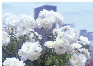
K・Y様撮影 中之島のバラ

三室戸寺の紫陽花は斜面に咲いて西日があたる時の美しさはまるで極楽浄土。(Y・N様)