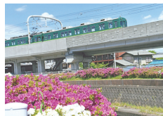
寝屋川市駅の躑躅