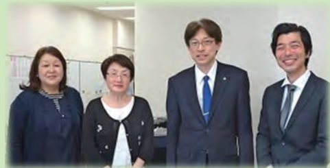
「私達のご案内します！」