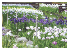
山田池公園の菖蒲

大阪ゆうゆうの里は近隣にお花を楽しめる公園や場所がたくさんあります。季節の花を愛でるご入居者が環境を活かして、いかに楽しまれていくかご紹介致します。