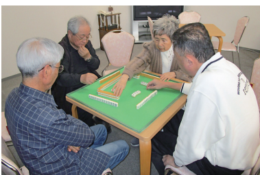
麻雀の腕前はかなり上達しました