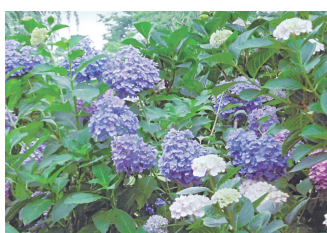
三室戸寺の紫陽花

「誰でも花を贈られるとうれしい気持ちになります。花は人を癒したり、時には希望を与えてくれます。花を愛でるご入居者は元気で明るい方ばかりというのも納得です。」荻原記